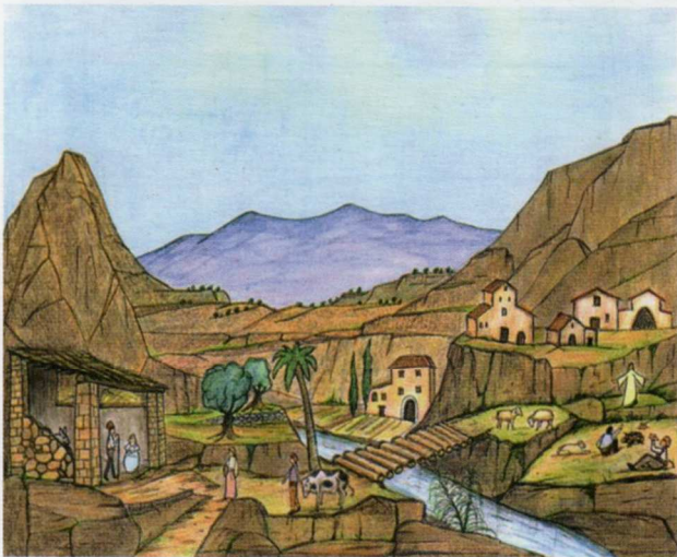
Dibuix: Joan Saez

Busca en aquesta sopa de lletres 10 elements que apareixen en el dibuix d'aquest pessebre.